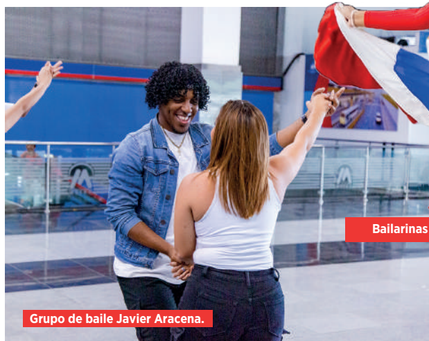
Grupo de baile Javier Aracena.