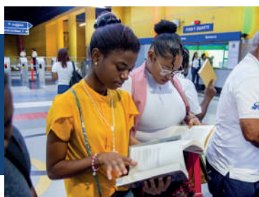
Donación de libros en colaboración con el Archivo General de la Nación.