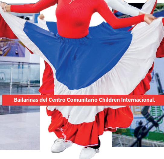
Bailarinas del Centro Comunitario Children Internacional.